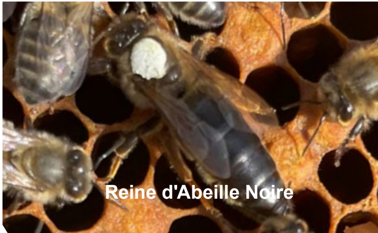
Reine d'Abeille Noire

Utilisée dans ce contexte, Buckfast est une merveille capable de ramasser des masses considérables de miel. Le monde agricole est familier de l'hybridation mais il a parfaitement compris qu'il ne faut pas utiliser la descendance de cette hybridation comme reproducteur ou comme semence. et achète des reines F1 Buckfast tous les ans.