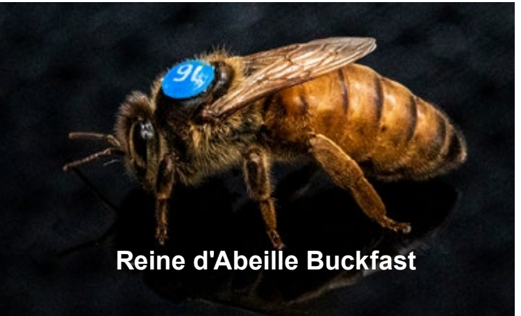
Reine d'Abeille Buckfast