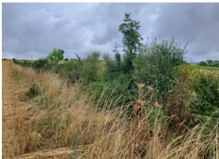
Jeune haie plantée il y a 5 ans chez un éleveur de bovins viande