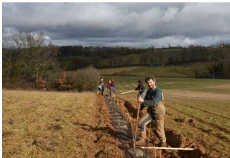
Chantier de plantation sur la commune de Najac