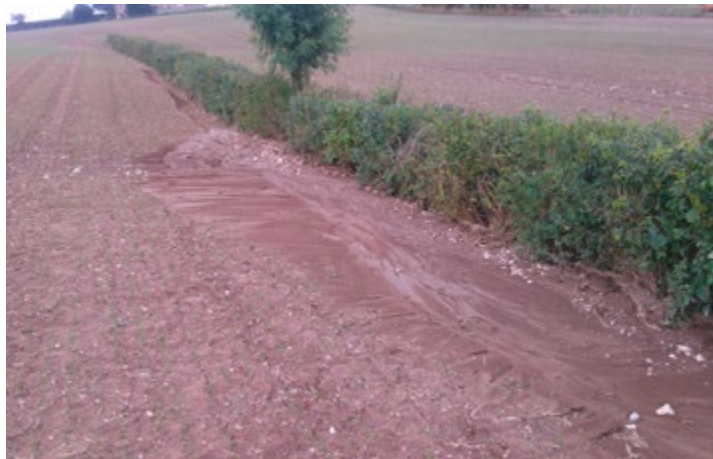
Terre retenue par une jeune haie après un orage